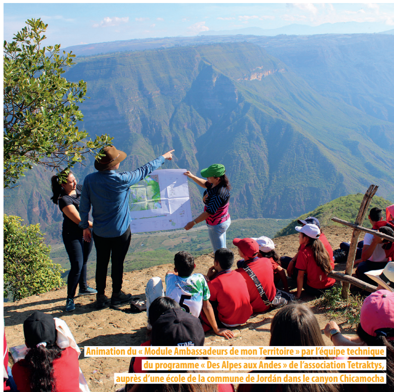
Animation du « Module Ambassadeurs de mon Territoire » par l'équipe technique du programme « Des Alpes aux Andes » de l'association Tetraktys, auprès d'une école de la commune de Jordán dans le canyon Chicamocha