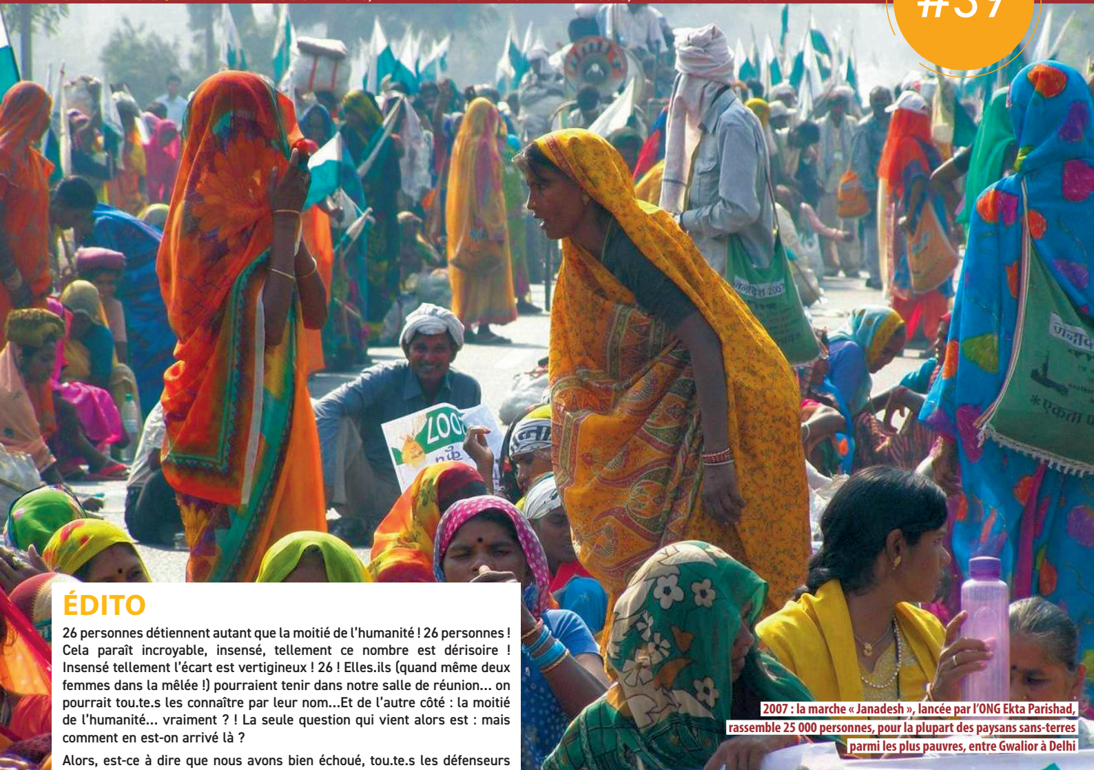
2007 : la marche « Janadesh », lancée par l'ONG Ekta Parishad, rassemble 25 000 personnes, pour la plupart des paysans sans-terres parmi les plus pauvres, entre Gwalior à Delhi