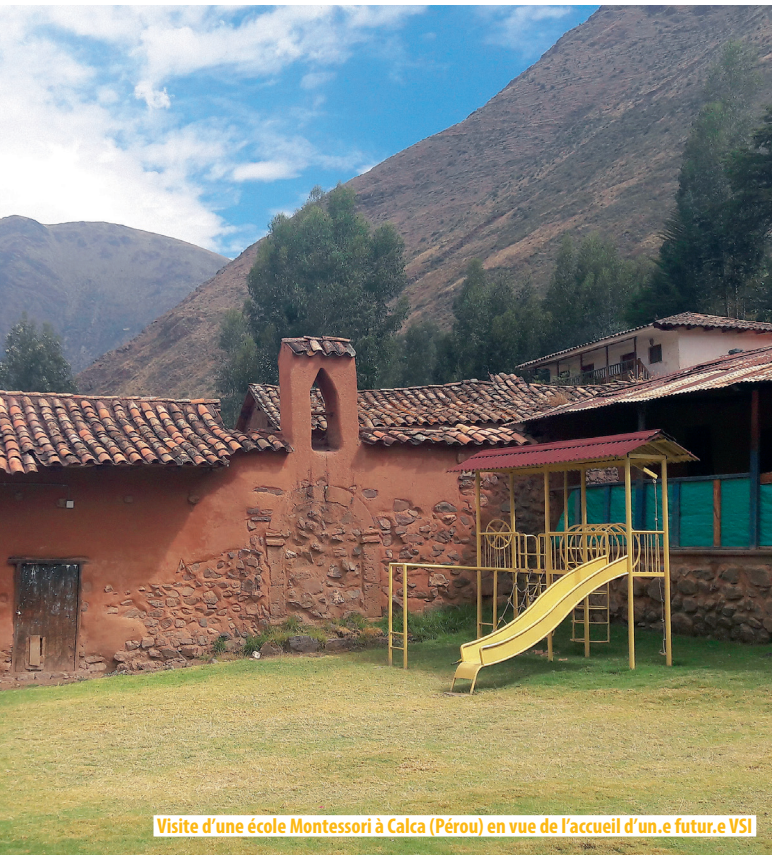
Visite d'une école Montessori à Calca (Pérou) en vue de l'accueil d'un.e futur.e VSI

En mai, départ pour le Mozambique : grand pays, aux distances rallongées avec beaucoup de ressources naturelles. Mais le climat n'est pas un allié de tous les jours et les catastrophes naturelles sont fréquentes. À Beira, dans le Nord du pays, le passage d'un cyclone en mars n'a pas épargné les locaux de nos partenaires. Théoneste a pu faire le point avec nos cinq volontaires : la situation s'améliore même si les plans d'urgence ont pris le pas sur les missions de développement. Au Mozambique les besoins principaux exprimés pour les missions de volontariat concernent principalement l'environnement et l'éducation. Deux thèmes qui permettent de mieux construire l'avenir. Les rencontres avec Amor, Essor, Inter Aide et les volontaires ont permis de donner du corps à ces missions du bout du monde et d'imaginer des perspectives communes.