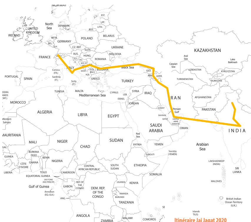
Itinéraire Jai Jagat 2020

Isaline MERLE D'AUBIGNE Ancienne volontaire du SCD engagée sur la marche Jai Jagat 2020