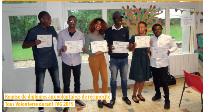
Remise de diplômes aux volontaires de réciprocité Tous Volonterre durant l'AG 2019

L'assemblée générale du SCD a été l'occasion de remercier les volontaires de réciprocité TOUS VOLONTERRE pour leur engagement et leur remettre l'attestation de Service Civique. C'est avec tristesse que nous leur avons dit au revoir, leur souhaitant le meilleur pour leurs futures aventures!