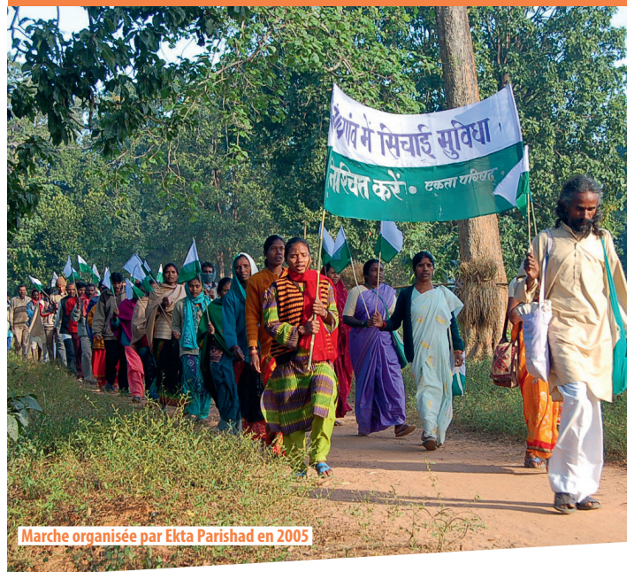
Marche organisée par Ekta Parishad en 2005